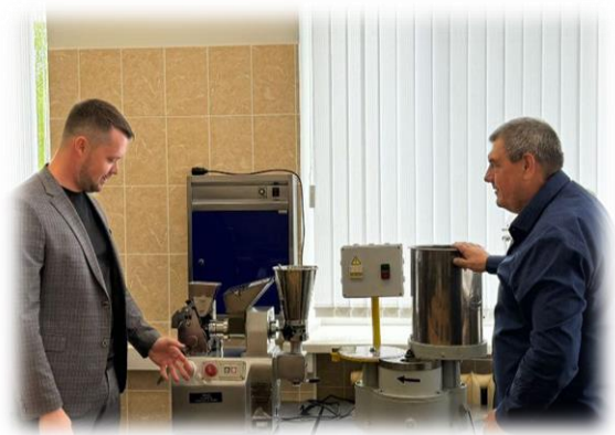
Владимир Бутенко с инспекцией наказов в г.о. Чехов

дополнительных мероприятий по развитию жилищно-коммунального хозяйства и социально-культурной сферы по предложению Владимира Бутенко в текущем году для нужд учреждения было закуплено и установлено оборудование и акустическая система. Депутат проверил исполнение данного наказа. Коллективу учреждения было вручено Благодарственное письмо от Московской областной Думы, а также дополнительно для нужд учреждения подарено мультифункциональное устройство.